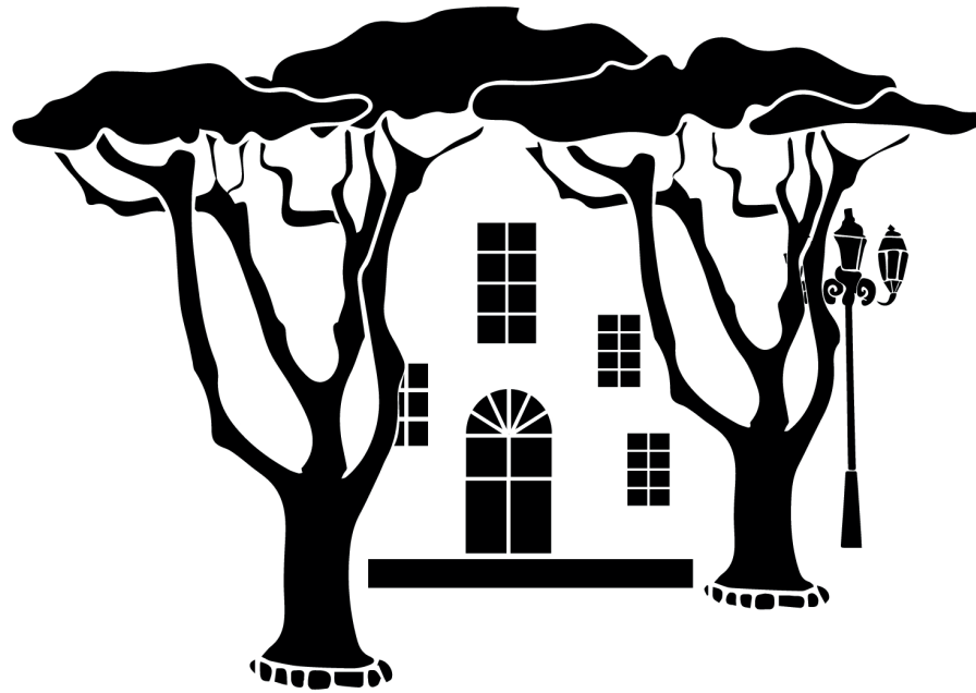
VILLA KERSELL PLACE DES LICES, SAINT-TROPEZ